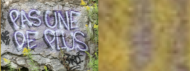
(C'est là, pour pas de plus (Maitre-may))

© DDM-l'Voie Juin 2024 6 cordes acoustique dreadnought